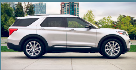
Star White Metallic Tri-coat