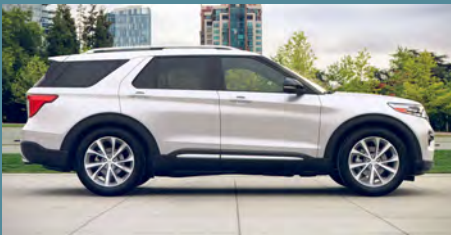
Star White Metallic Tri-coat